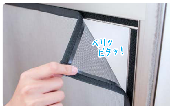
01 ネットカートリッジの脱着は超シンプルな面ファスナー式!