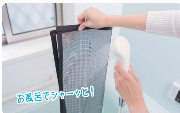
02 手軽に洗えるからいつもキレイに保てる!