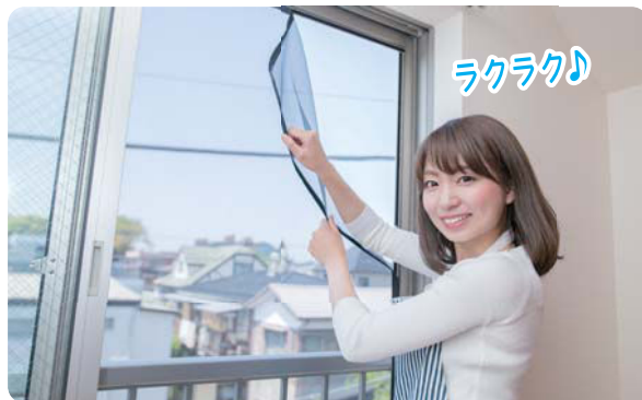
04 室内からカンタンにはずせる!