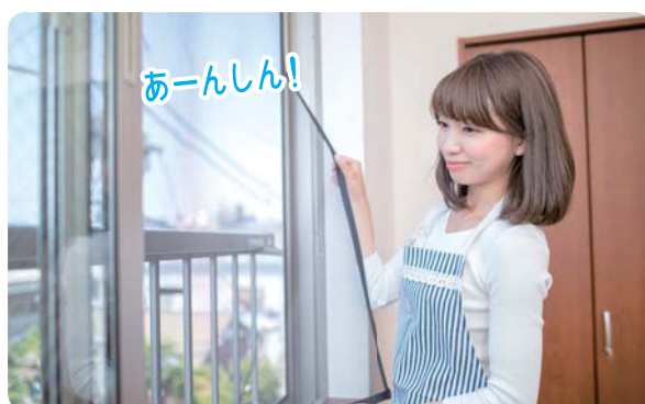
06 ベランダのない2階の窓でも網戸落下の心配なし